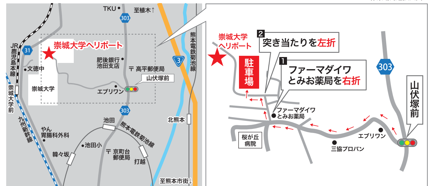
<作業場周辺拡大図>